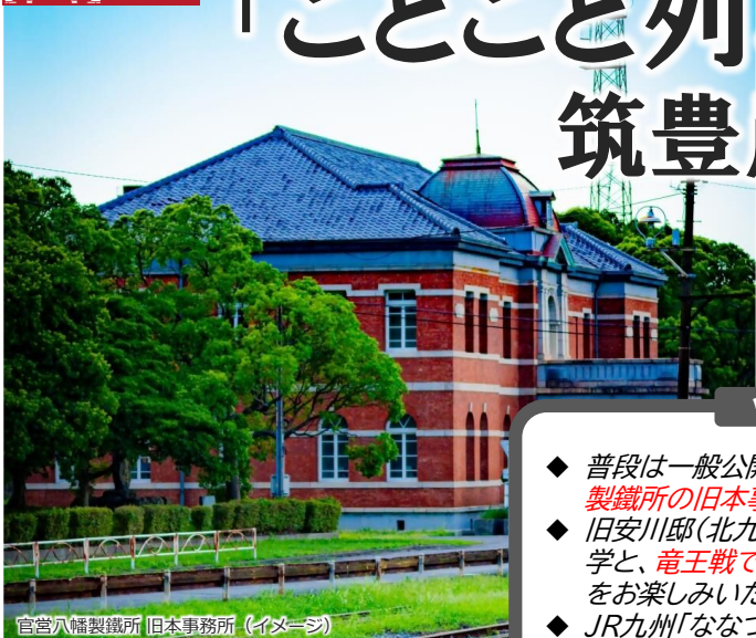
官営八幡製鐵所 旧本事務所 (イメージ)